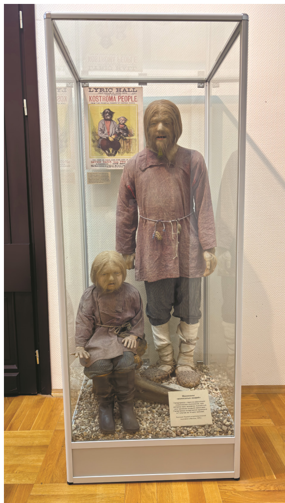
Рисунок 5. Манекены, выполненные И.И. Севрюгиным, демонстрирующие атавистический признак – повышенную оболоченность лица и тела (гипертрихоз)