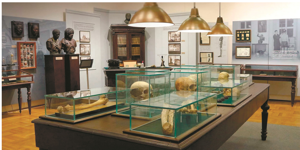
Рисунок 2. Музей антропологии МГУ, 2025 г. Figure 2. Museum of Anthropology, Moscow State University, 2025