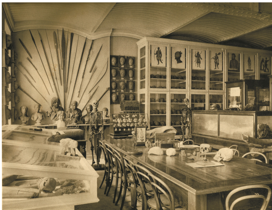
Рисунок 1. Экспозиция Музея антропологии в помещении Государственного исторического музея. 1886 г.