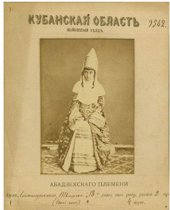
Рисунок 5. Девушка из Майкопского уезда (абадзехское племя). Собиратель Е.Д. Фелицын. 1877–1878 гг. Figure 5. A girl from Maikop district (Abadzeh tribe). Collector E.D. Felitsyn. 1877–1878s