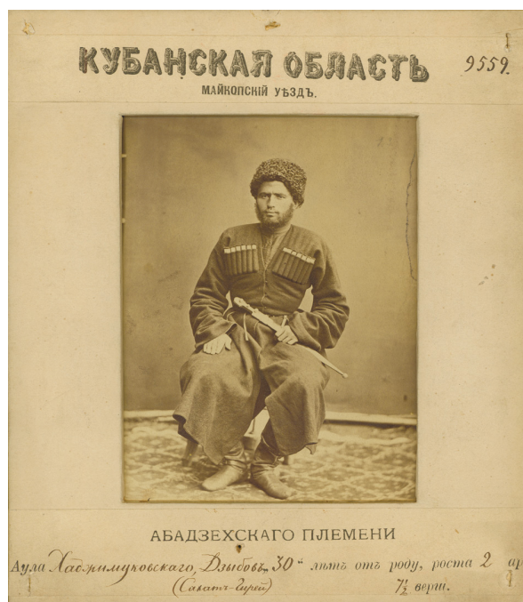
Рисунок 2. Житель Майкопского уезда (абадзехское племя). Собиратель Е.Д. Фелицын. 1877–1878 гг. Figure 2. A resident from Maikop district (Abadzeh tribe). Collector E.D. Felitsyn. 1877–1878s