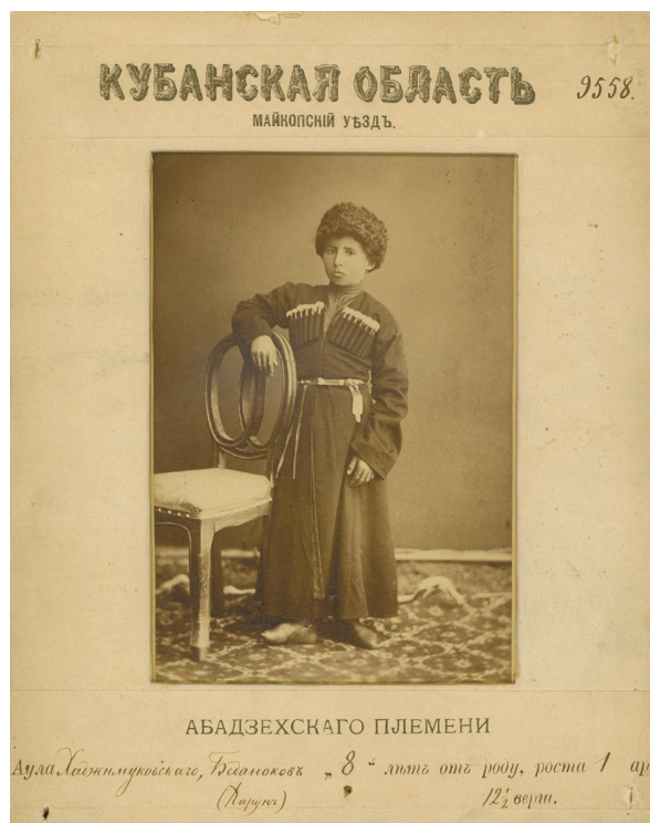
Рисунок 1. Мальчик из Майкопского уезда (абадзехское племя). Собиратель Е.Д. Фелицын. 1877–1878 гг. Figure 1. A Boy from Maikop district (Abadzeh tribe). Collector E.D. Felitsyn. 1877–1878s