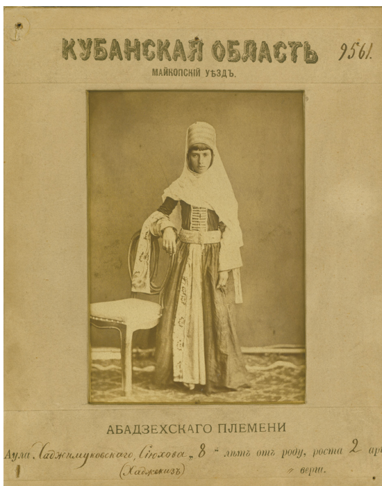
Рисунок 4. Девочка из Майкопского уезда (абадзехское племя). Собиратель Е.Д. Фелицын. 1877–1878 гг. Figure 4. A girl from Maikop district (Abadzeh tribe). Collector E.D. Felitsyn. 1877–1878s