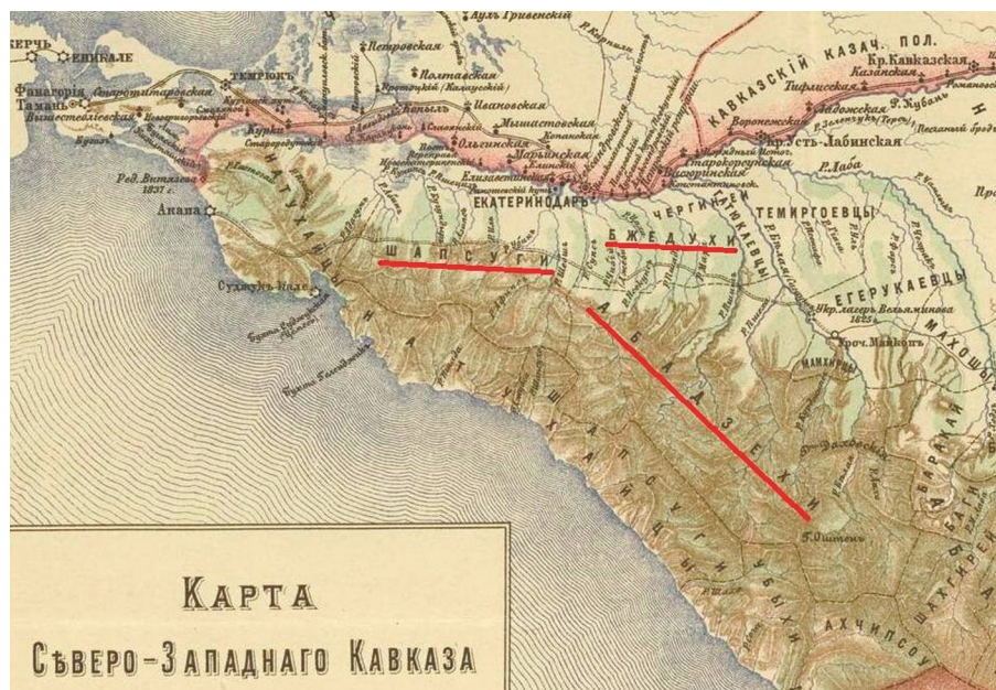
Рисунок 8. Карта Абадзехии (Северо-Западного Кавказа)

( https://www.livekavkaz.ru/index.php?newsid=14280#sel=6:17,6:20 . Дата обращения – 06.03.2025)