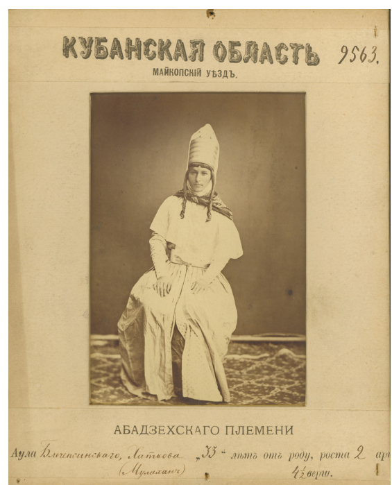
Рисунок 6. Жительница Майкопского уезда (абадзехское племя). Собиратель Е.Д. Фелицын. 1877–1878 гг. Figure 6. A resident from Maikop district (Abadzeh tribe). Collector E.D. Felitsyn. 1877–1878s