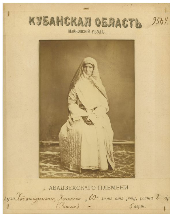
Рисунок 7. Жительница Майкопского уезда (абадзехское племя).